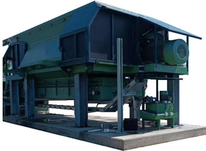
Abbildung 1 2x132kW Zerkleinerer

Die Vorzerkleinerung (Brecher) wird mit zwei Asynchronmotoren mit je 132kW Nennleistung ausgerüstet. Die Frequenzumrichter dazu sollen Überlast wie auch Anlauf unter Last ermöglichen.